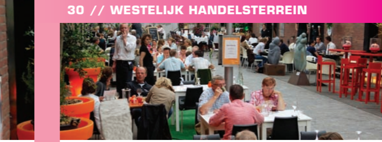
30 // WESTELIJK HANDELSTERREIN

De verbouwing van het Westelijk Handelsterrein, een rijksmonument uit 1894, werd voltooid in 2002. Het overdekte complex bestaat uit een verzameling van 36 pakhuizen, in een boven- en benedenstraat. Waar vroeger handel werd gedreven gaan nu kunst, uitgaan en winkelen hand in hand. In een paar stappen beland je van een galerie in een wijnbar, of van een restaurant in een loungeclub.