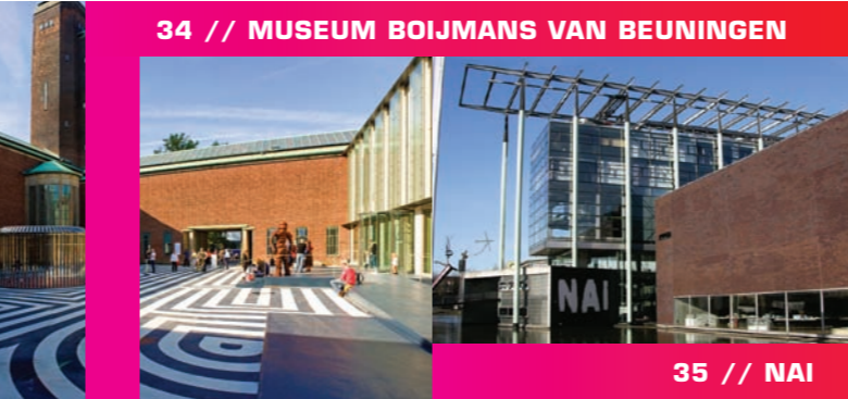
34 // MUSEUM BOIJMANS VAN BEUNINGEN

Jo Coenen (1993) Het NAI is dé plek voor architectuurliefhebbers. Per jaar worden zo'n 15 tijdelijke tentoonstellingen ingericht op het gebied van architectuur, stedenbouw en ruimtelijke ordening. De permanente tentoonstelling 'GeWoon Architectuur' geeft je een helder overzicht van de ontwikkelingen op woongebied in de Nederlandse Architectuur van 1850 tot nu. Het opvallende 'Museumparkbeeld' dat voor het NAI in het water staat, is van kunstenaar Auke de Vries, die ook het Maasbeeld ('de Waslijn') bij de Willemsbrug ontwierp. Met een toegangskaartje van het NAI is ook Huis Sonneveld te bezichtigen (zie Museumpark) met een interessante audiotour.