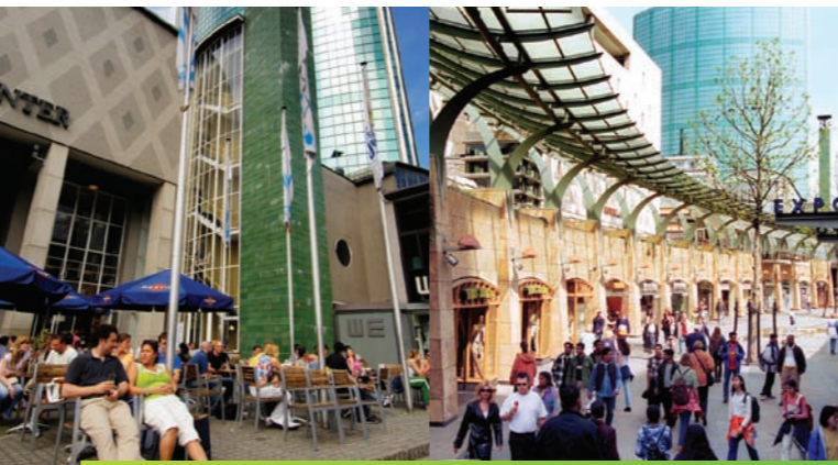
13 BEURS/WTC // 14 BEURSTRAYERSE

TIP Ga eens lekker binnen of buiten zitten bij boulevardcafé en brasserie Staal. Stijlvol en altijd gezellig druk, zowel met zakelijk als winkelend publiek.