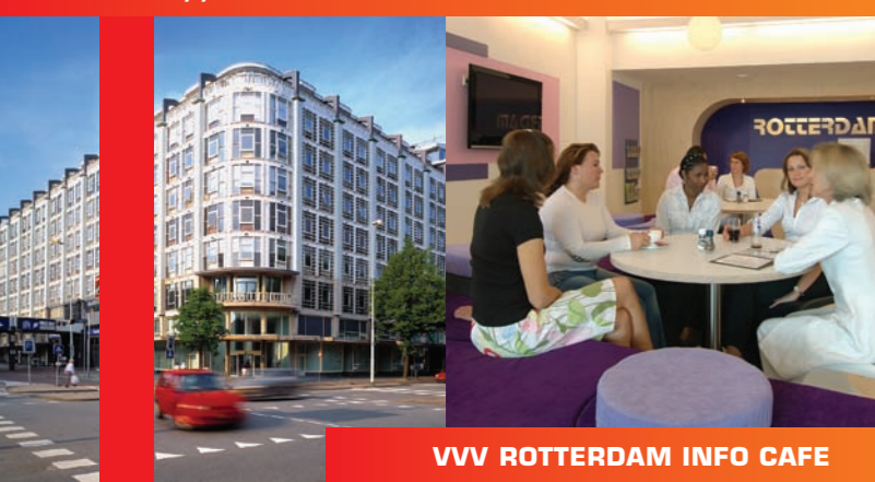
VVV ROTTERDAM INFO CAFE