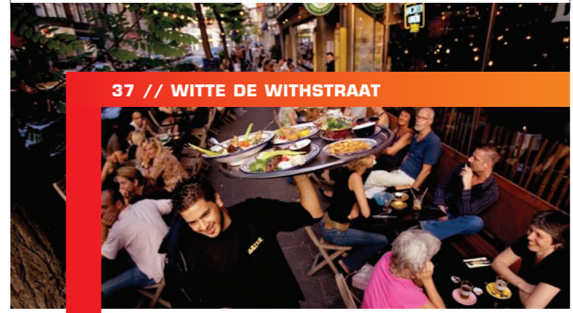
37 // WITTE DE WITHSTRAAT

Rotterdam Marketing Postbus 50255 / 5001 DE Rotterdam / (010) 205 15 00 contact@rotterdam-marketing.nl / www.rotterdam.info