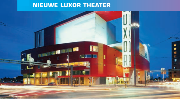
NIEUWE LUXOR THEATER

In dit oude stukje Rotterdam herinneren de monumentale en vaak rijk versierde panden aan de tijd van de reders en havenbaronnen. Tegenwoordig worden de scheepvaartkantoren, handelshuizen en consulaten afgewisseld met luxe appartementen, restaurants en winkels. In de