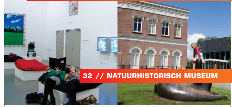
32 // NATUURHISTORISCH MUSEUM